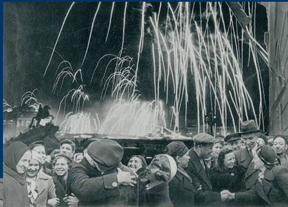
«ВЕЛИКАЯ ПОБЕДА ОДЕРЖАНА СОВЕТСКИМИ ВОЙСКАМИ ПОД ЛЕНИНГРАДОМ:»

Победе радовалась вся страна, но эта радость была со слезами на глазах, так как в каждой семье, в каждом доме кто-то погиб на этой страшной войне.