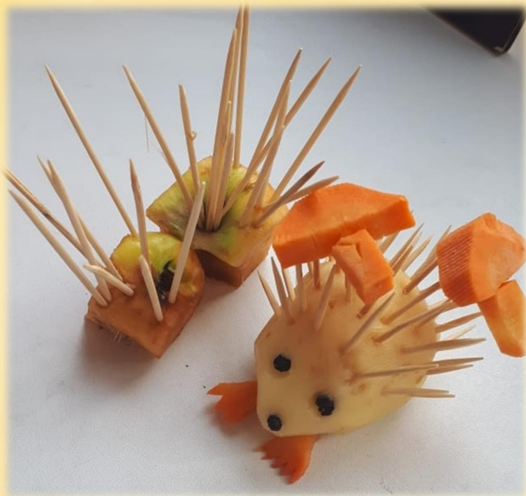
Князев Степа «Ёжик с грибами в лесу»